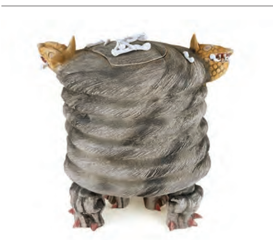
Maurice Savoie, T'ao-tieh , 1994 Faïence, porcelaine, pigment, 41 x 43 x 43 cm

EN COUVERTURE : Michael A. Robinson, Merge (détail), 2004, image numérique, 107 x 147 cm